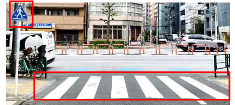
【省略可となる標識のイメージ】