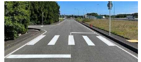
【白線の設置間隔拡大イメージ】